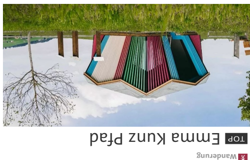
TOP Emma Kunz Pfad