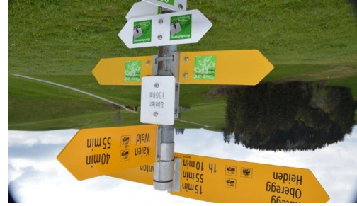
Wegweiser auf dem Gesundheitsweg im Appenzeller Vorderland.