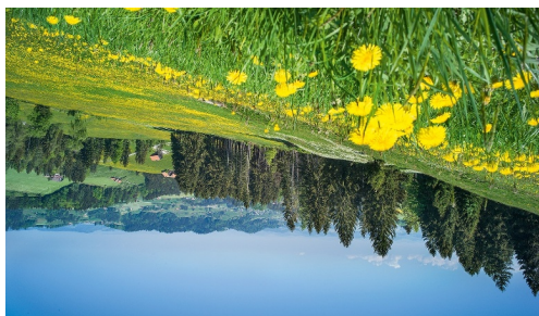
Goldene Blütenpracht mit Löwenzahn und Hahnenfuss.