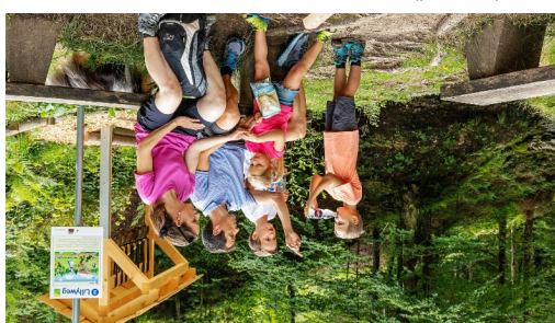
Rast an der Feuerstelle

gemeinde@urnasch.ch +41 71 365 60 60 9107 Urnäsch Dorfplatz 1 Feuerstelle EMU-Hüsli Grillplatz „Tipp des Autors“