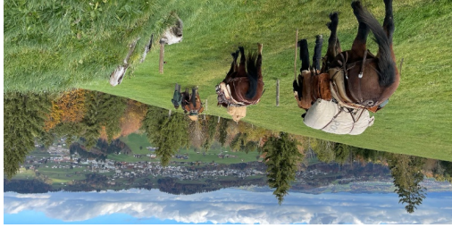
TOP Säummerweg Wanderung