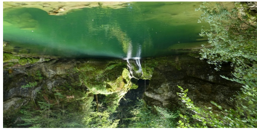
TOP Urnäsch-Schlucht Wanderung

Kartengrundlagen: outdooractive Kartografie; OpenStreetMap (www.openstreetmap.org) Geodaten © swisstopo