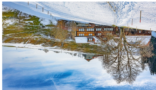
Hörli Speicher, mit Blick auf die Krete im Birt Foto: Jolanda Spengler, Appenzeller Verlag, Appenzellerland Tourismus AR

info@krone-speicher.ch http://www.krone-speicher.ch/ Quelle: Appenzellerland Tourismus AR