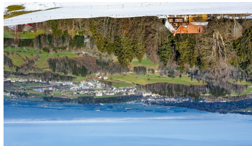
Hohruti Speicher, mit Blick auf St. Gallen Ost