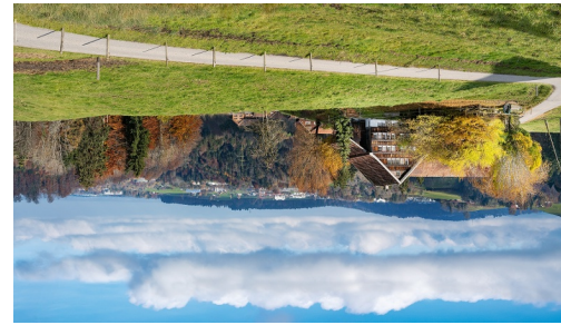
9042 Speicher