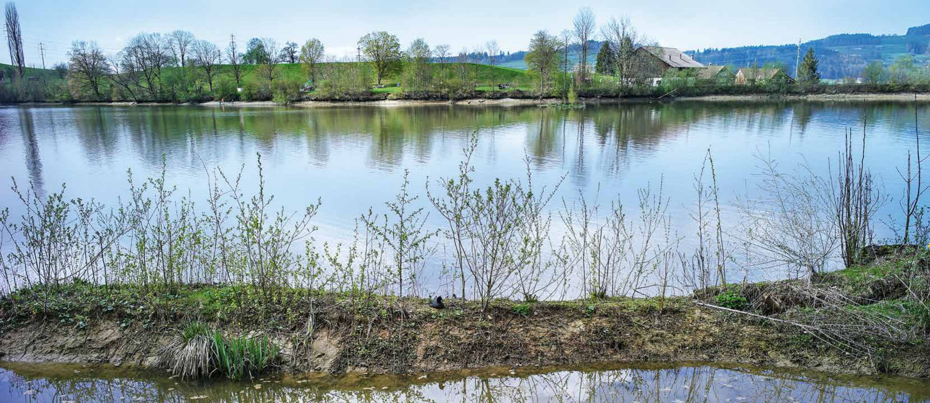
ABWECHSLUNGSREICHER LEBENSRAUM: Die Flora rund um den Gübsensee steht kurz vor dem Frühlingserwachen.