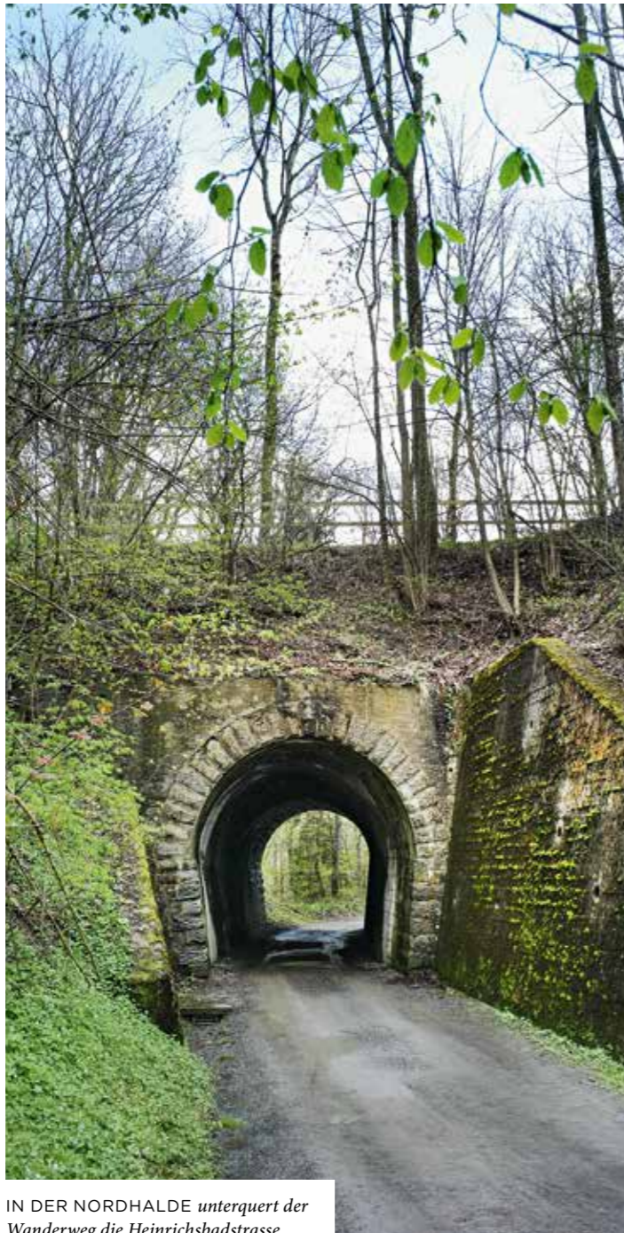
IN DER NORDHALDE unterquert der Wanderweg die Heinrichsbadstrasse.