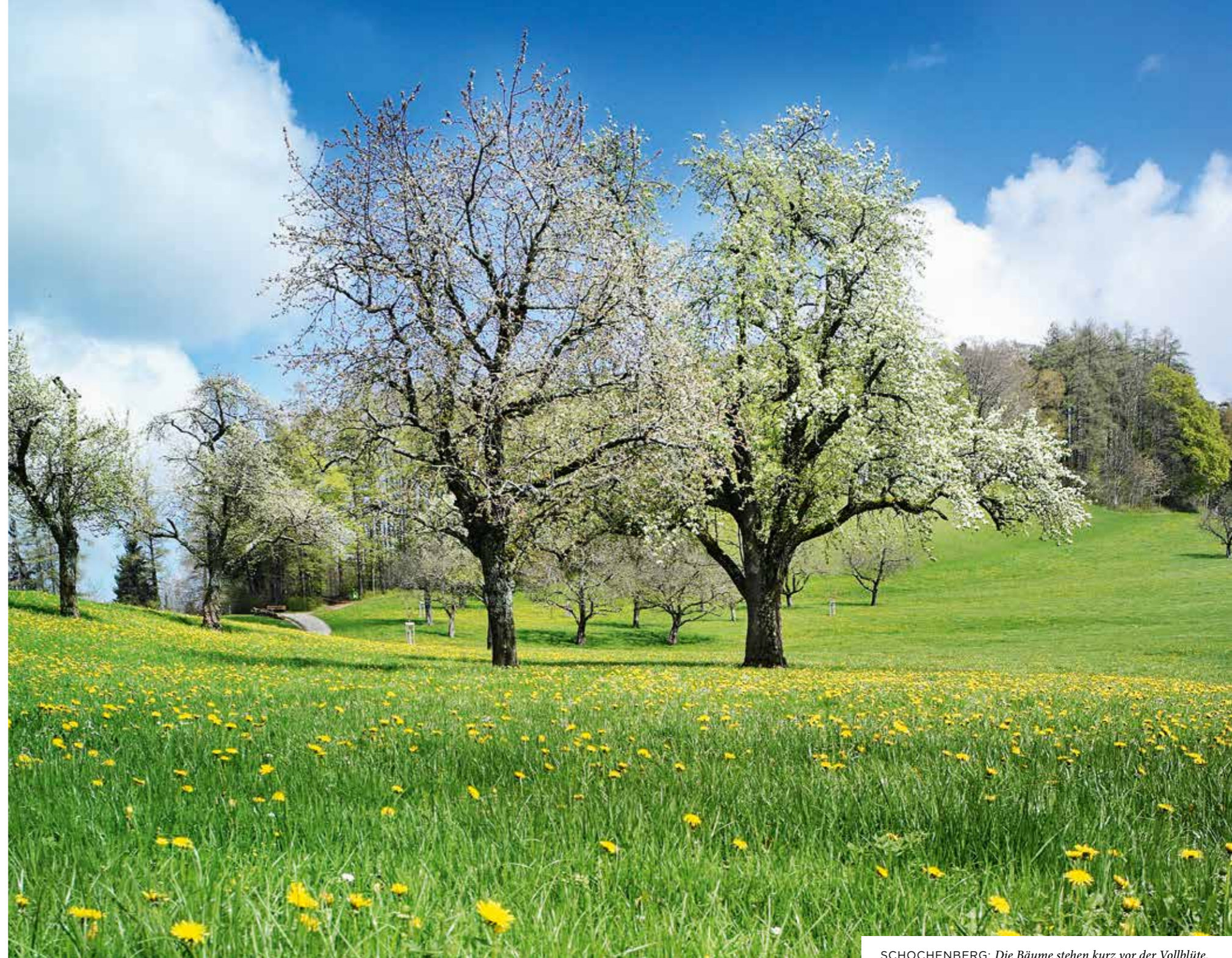
SCHOCHENBERG: Die Bäume stehen kurz vor der Vollblüte.

Der Gübsensee liegt zwar auf St. Galler Boden, als Naherholungsgebiet ist er aber auch bei Wanderern aus Herisau beliebt. Die Grenze zu Appenzell Ausserrhoden ist nah, sie führt hangwärts dem Bahntrasse der Südostbahn entlang. Einer Vielzahl an Vogelarten und Insekten bieten die Magerwiesen, Hecken und Wälder rund um den See einen abwechslungsreichen Lebensraum. Aus dem Gübsenseewasser wird im Kraftwerk Kubel seit über hundert Jahren elektrische Energie gewonnen. Über einen Zuflusstollen gelangt Wasser aus dem Appenzellerland in den See – von der Urnäsch und von der Sitter.