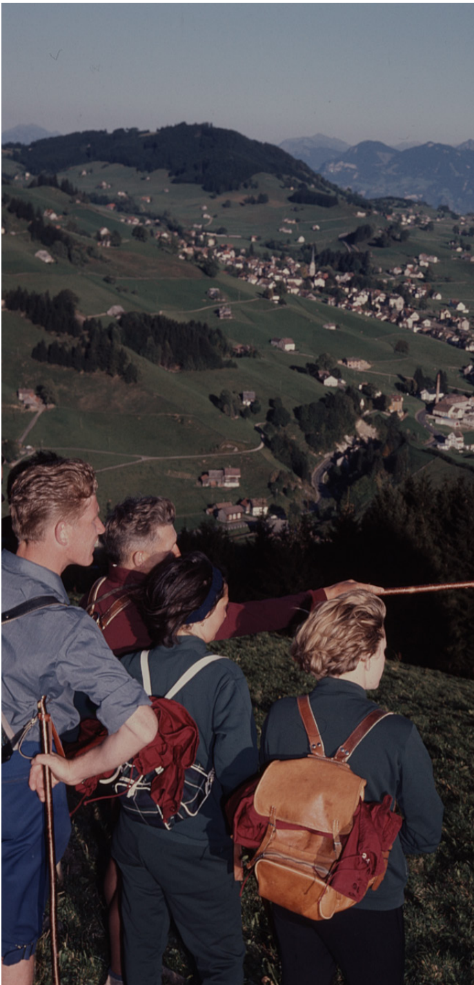
Die «Blauen» führten auf ihren Wanderungen den unverkennbaren Stock mit, wie eine Aufnahme aus den 1970er-Jahren zeigt.

Zahlreiche Bilder bezeugen das Molkenkurwesen, das in Gais von 1750 bis 1860 blühte. Ein Jahrhundert später tauchte dort ein neues gesundheitstouristisches Phänomen auf: die Klimastation für «Zivilisationsgeschädigte», die der Arzt Gerhard Ufer 1959 im heutigen Museumsgebäude errichtete. Betriebe schickten ihre körperlich und nervlich angeschlagenen Angestellten zu einer vierwöchigen Kur ins ländliche Gais. Mit blauen Trainingsanzügen und einem Stock ausgestattet, sollten sich die «Blauen» mittels Bewegungstherapie, Spaziergängen und Saunabesuchen von ihren Beschwerden erholen. Die erfolgreichen Kuren führten 1965 zur Gründung der heutigen Klinik Gais.