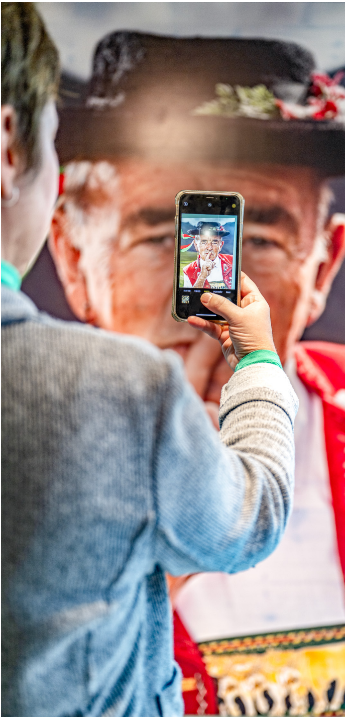
Ein Werbeplakat mit sennischem Motiv. Was erzählt es über das Appenzellerland?

in der Ergründung der Ursprünge des Sennischen und des Kultes um die Kuh schafft die Ausstellung einen direkten Bezug zur Gegenwart: Der Bogen wird gespannt zu stark vermarkteten und teilweise überlaufenen Orten im Appenzellerland und der damit verbundenen Social-Media- und Selfie-Kultur. Es werden dabei auch Fragen zu eher problematischen Seiten des Tourismus gestellt und die exzessive Vermarktung von traditionellem Kulturgut angesprochen.