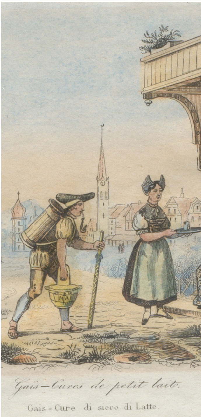
Einer der legendären Schottenträger, die täglich für die Kurgäste die Molke von der Alp «Oberer Mesmer» nach Gais brachten. Radierung, koloriert, um 1835.

Im 20. Jahrhundert versuchen sich einzelne Orte auch als Winterdestination zu etablieren. Es entsteht eine ganze touristische Infrastruktur mit Bahnen, Skiliften und Bädern, die gezielt beworben werden – allen voran die 1935 fertig erstellte Luftseilbahn Schwägalp-Säntis.