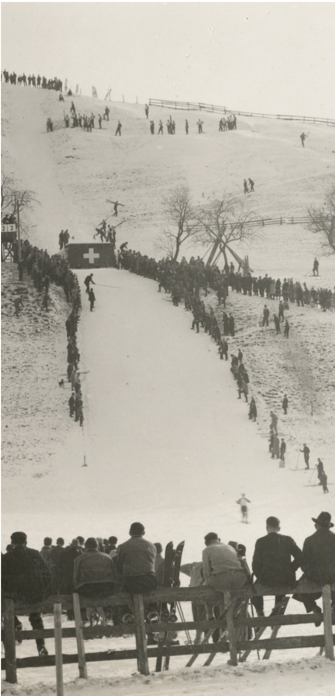
1932 eröffnete der Ski-Club Urnäsch die Sprungschanze im Feld, die – wie eine Postkarte zeigt – viel Publikum anzog.

1906 gegründet, hat der Ski-Club Urnäsch schon früh den Wintertourismus im Appenzeller Hinterland geprägt. Er veranstaltete Rennen und eröffnete 1932 eine spektakuläre Sprungschanze. 1944, mitten im Krieg, erstellten sechs Männer kühn den ersten Skilift in der Ostschweiz. Bereits in den 1970er-Jahren wurden Beschneigungsanlagen installiert. Eine Neuheit, für welche 1978 eine Delegation aus dem bündnerischen Savognin zur Besichtigung anreiste.