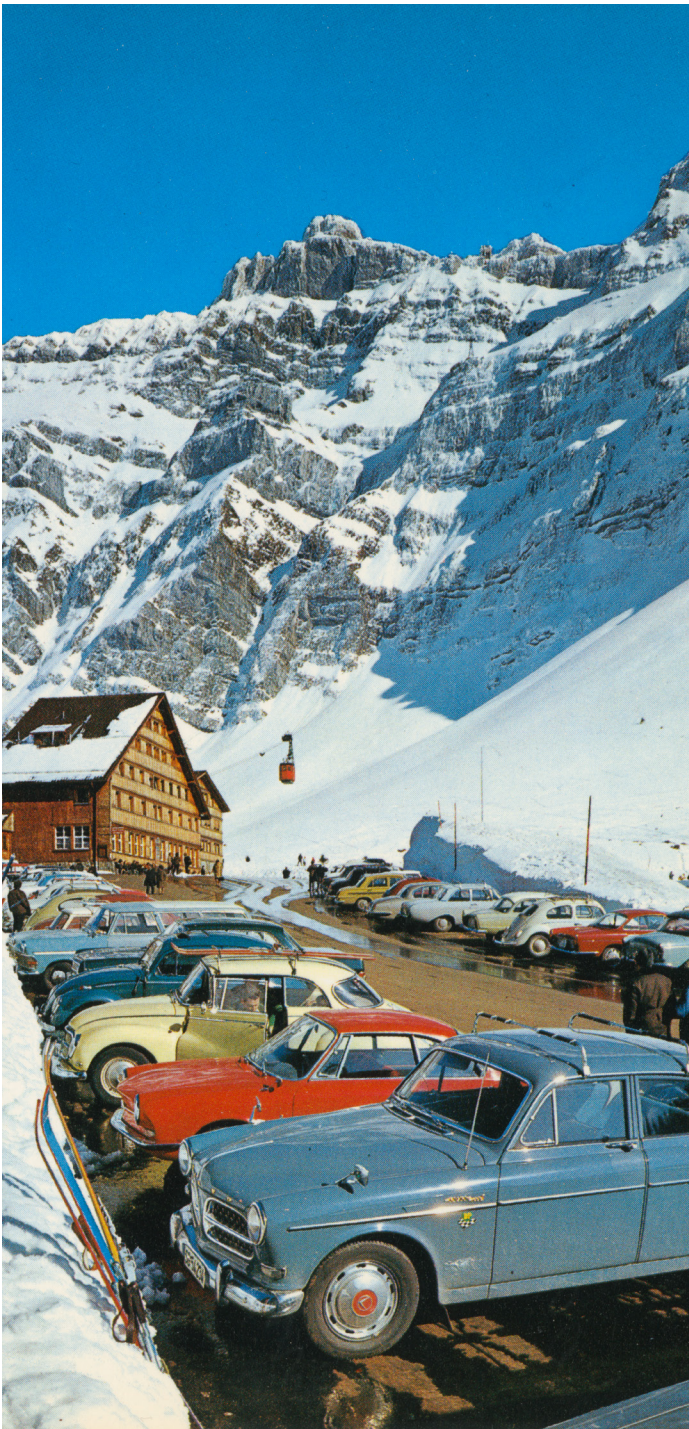
Die Schwägalp und der Säntis ziehen bereits in den 1970er-Jahren die mobilisierten Massen an. Postkarte, um 1970.

Während die Übernachtungen in Appenzell Ausserrhoden seit einigen Jahrzehnten sinken, nimmt der Tagestourismus stetig zu: Das Appenzellerland wird zum Ausflugsziel vorwiegend von Deutschen und Österreicherinnen und zum Naherholungsgebiet der ganzen Ostschweiz.