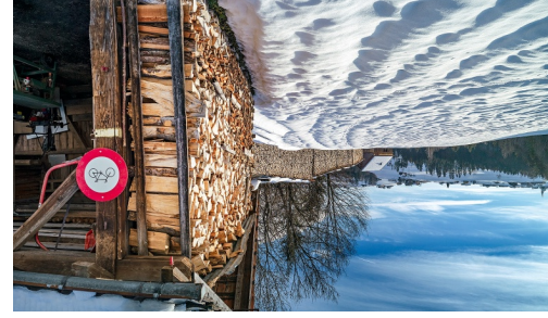
Halten: Bauernhöfe vor der Hundwiler Höhe und dahinter der Alpestein