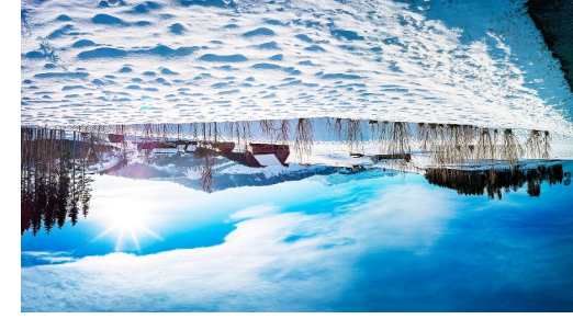
Halten: Bauernhöfe vor der Hundwiler Höhe und dahinter der Alpestein