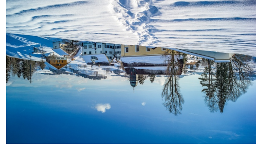
Kloster Wonenstein: Heimat von sieben Kapuzinerinnen