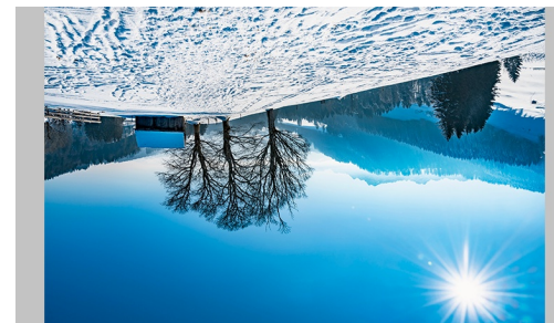
REIENBENET, OST, Trogen: Blick nach Südwesten zum Alpenstein