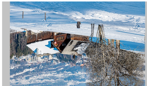
NISTELBÜEL, Trogen, mit Blick über das Dorf Trogen zu den Rehetöbler Weibern Lobschwendi und Michlenberg