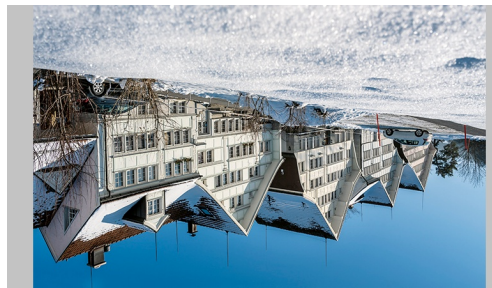
NEUSCHWENDI, Trogen, mit typischen Appenzellerhäusern.