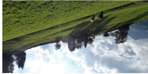
TOP Kraftort Urnäsch