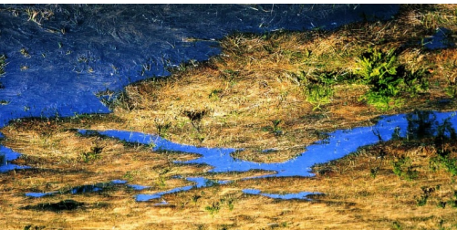
TOP Themenweg Moor App Themenweg

Titelbild: Hochmoor Foto: Kartengrundlagen: outdooractive kartografie; OpenStreetMap (www.openstreetmap.org) Geodaten © swisstopo