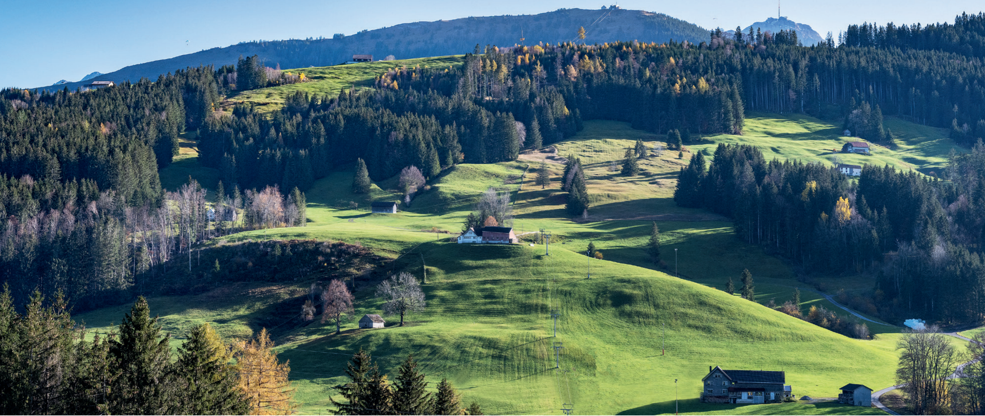
GROSSGADEN, Hundwil, mit Blick gegen Süden zur Lauftegg. Dahinter erheben sich Kronberg und Säntis.