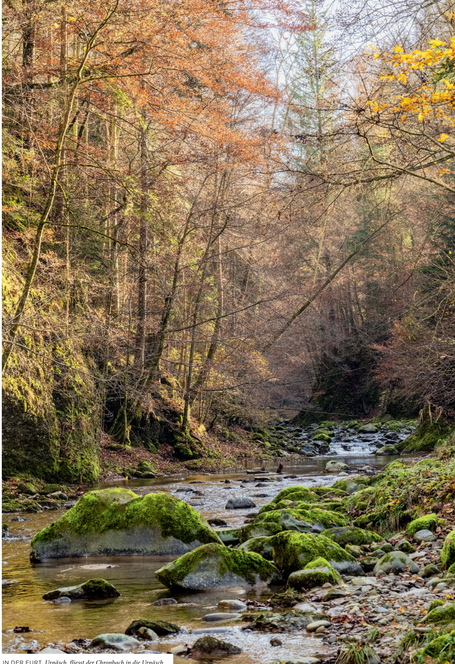
IN DER FURT, Urnäsch, fliesst der Chronbach in die Urnäsch.