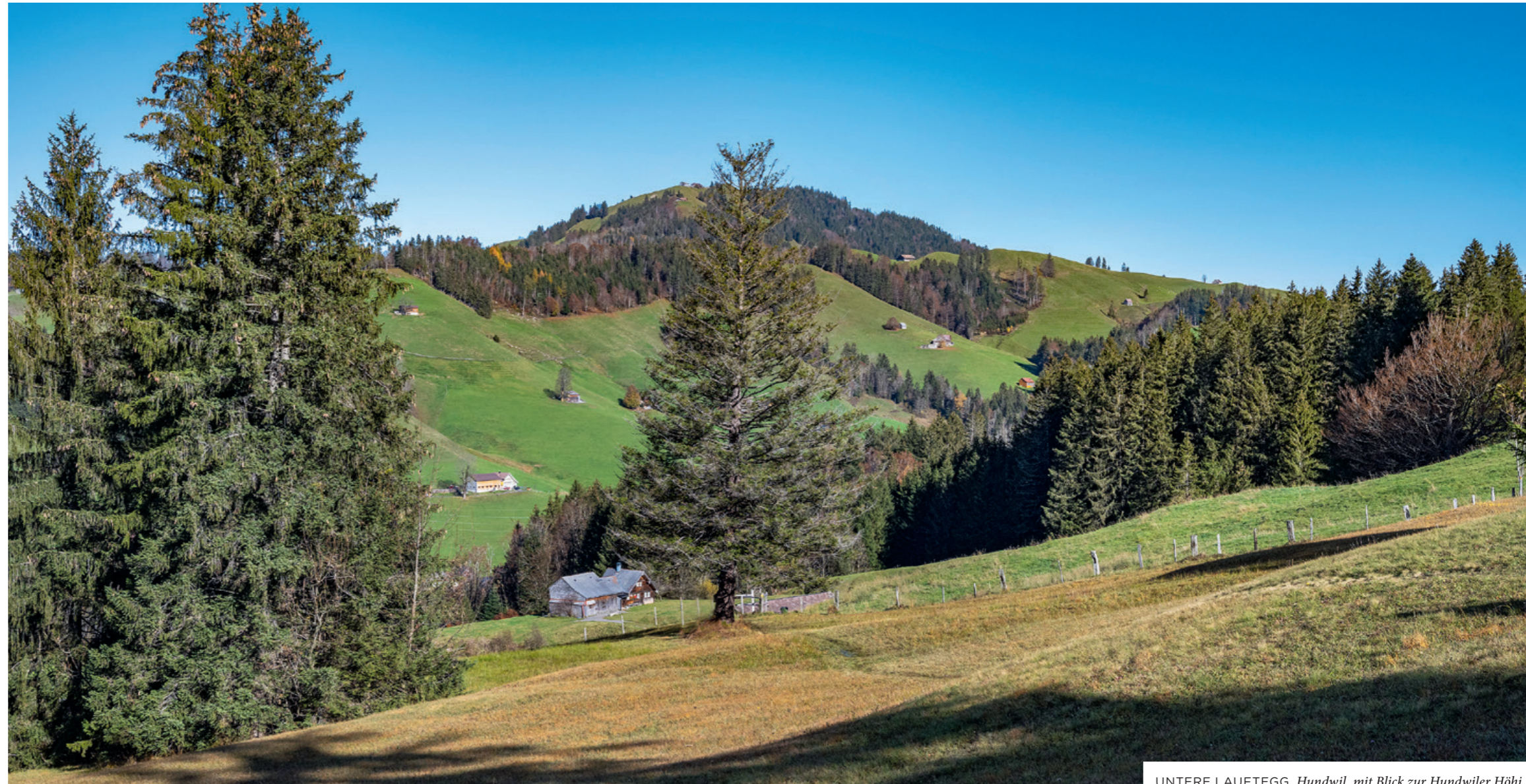
UNTERE LAUFTEGG, Hundwil, mit Blick zur Hundwiler Höhi.