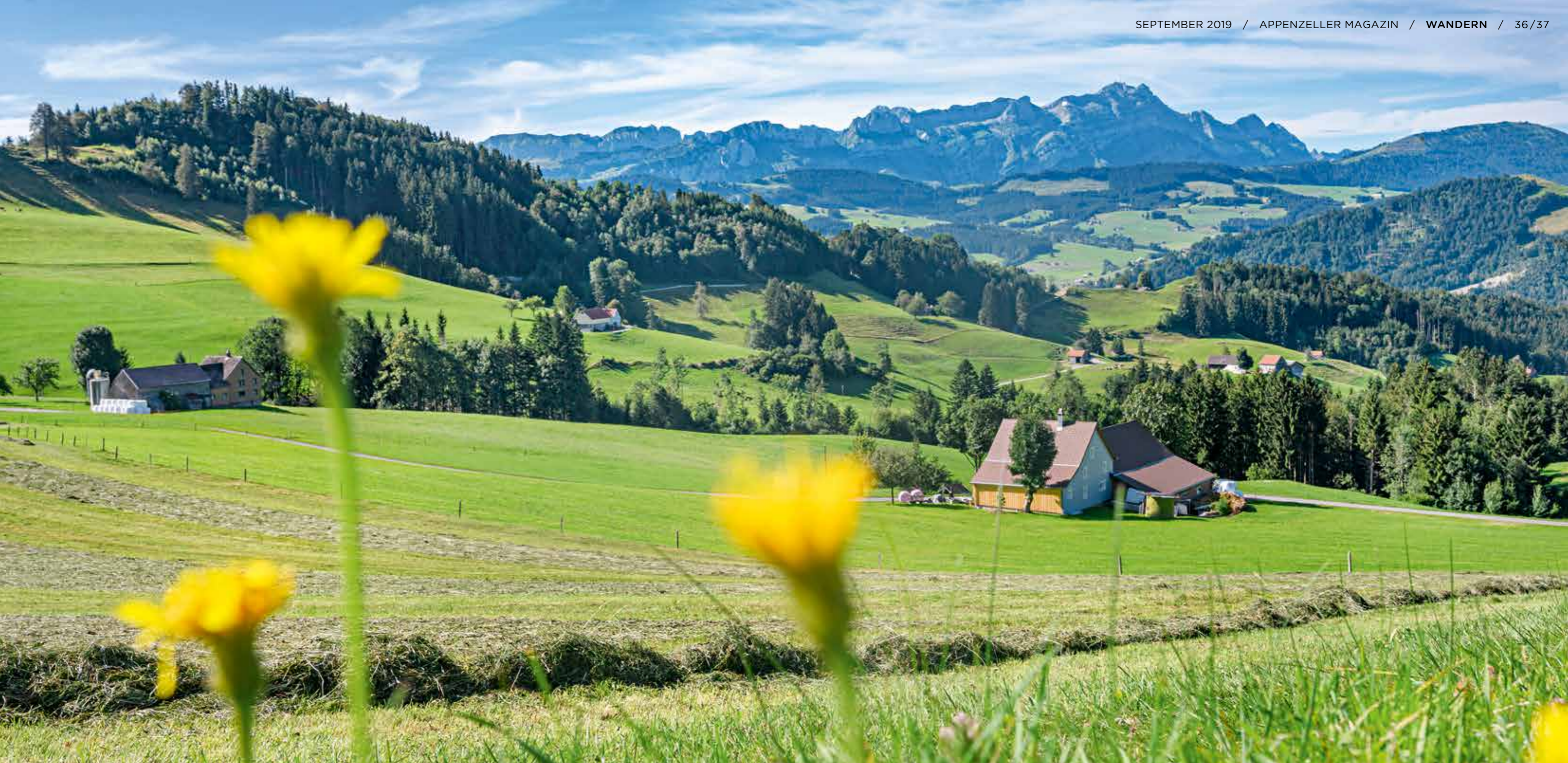
LEIMENSTEIG: Hinter Gehrenbergwald, Neuenalp und Kronberg erhebt sich der Alpstein mit dem Säntis.