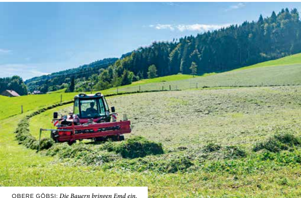
OBERE GÖBSI: Die Bauern bringen Emd ein.